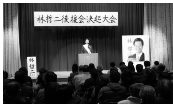
3月17日(土)決起集会(市民会館にて)